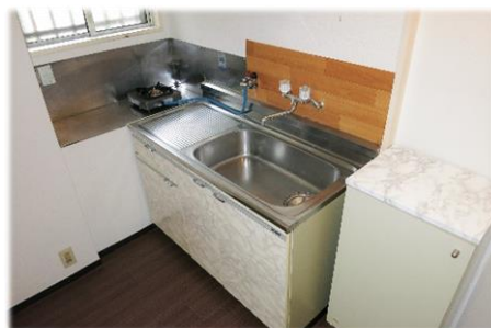
▲1口ガスコンロ付のキッチン 2口ガスコンロも設置可能です