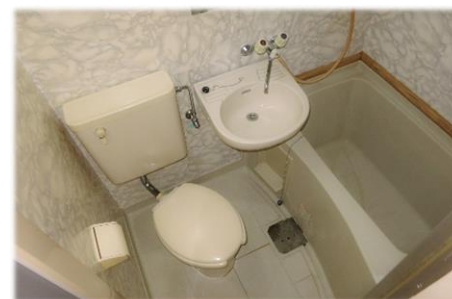
▲白を基調としたユニットバス