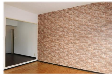
▲壁の片面はレンガ調のクロス